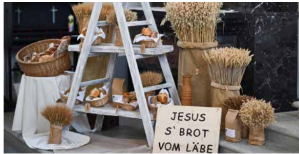
Dekoration der Erstkommunion 2024 in Mühlau.

Am Sonntag, 28. April feiern wir in Auw und Dietwil Erstkommunion zum Thema «Jesus - s' Brot vom Läbe». Die Katechetinnen führen die Kinder zur Begegnung mit Jesus im Brot heran. Sie erklären ihnen, was dieses spezielle Brot, diese Begegnung mit Jesus im Brot, für eine grosse Bedeutung und Kraft