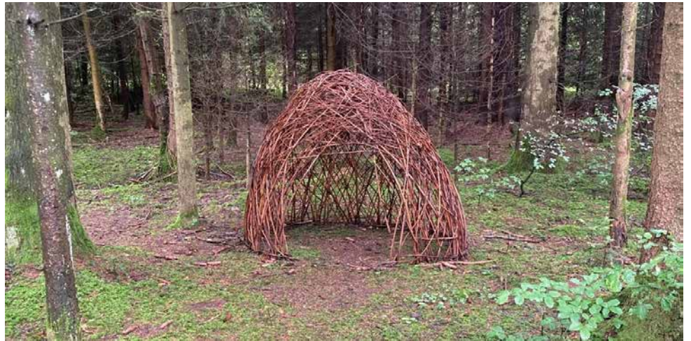
Zwischen Kloten und Bülach 2024

Nach den Sommerferien pilgern wir am Samstag, 16. August weiter und freuen uns auf rege Teilnahme. Hinfahrt ab Brugg 7.52 (Gleis 3 hinten), Wanderung: Eglisau–Kirche Buchberg–Rüdlingen–Ellikon–Rheinau, 17.5 km, 5 Std. Wem die Tour zu streng ist, kürzt die ersten 6 km ab: Brugg ab 8.36 (Gleis 2 hinten), Henggart an 9.50/ ab 10.00 (Bus), Kirche Buchberg an 10.25, wo man sich mit den Weitpilgern trifft. (Leitung Kurzgruppe: Urs). Billett bitte individuell lösen (Rheinfähre Ellikon kostet noch CHF 3) und Picknick mitnehmen. Mehr Informationen im Schriftenstand unserer Kirche und auf www.kathbrugg.ch . Agnes Oeschger, 079 582 11 82 und Urs Näf, 079 660 10 06.