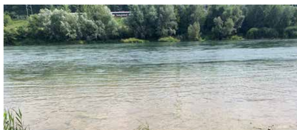
Aare bei Brugg